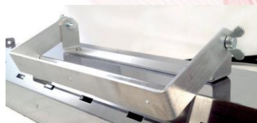
Bras de suspension réglable pour rayonnement directionnel.